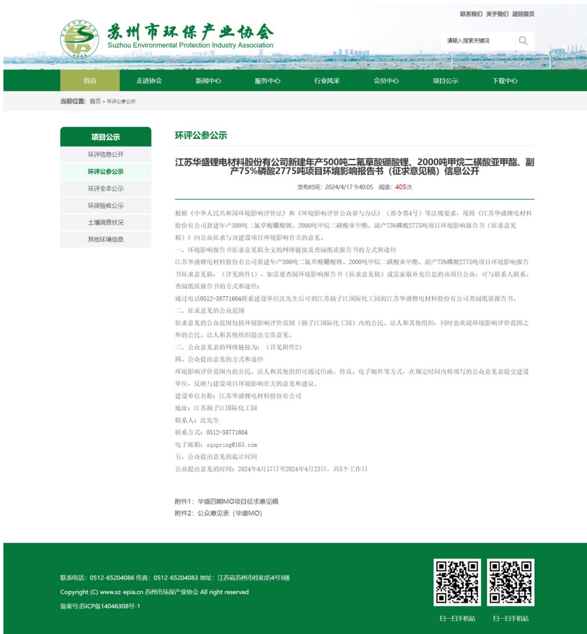
图 3-1 项目环评期间征求意见稿公示网站页面